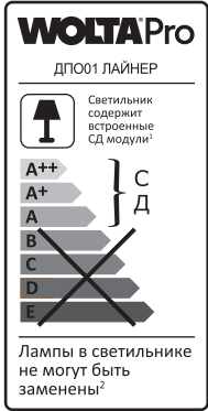
1 Шамда кіртірілген ЖД модульдері бар

«Вольта Русланд» ЖШҚ тапсырысы бойынша шығарылған, 119361, Мәскеу қ., Наташа Ковшова к-сі, 4 ұй, 1 бет, оф. 23. Өндіруші: «Лайтлед» ЖШҚ, Ульяновск облысы, Ульяновск қаласы, Мәскеу тас жолы, 14 ұй. Өндіруші бұйымның конструкциясына (техникалық параметрлерді және/немесе сыртқы түрін өзгерту) және жиынтықтауға тұтынушылық қасиеттерін айтарлықтай өзгертпей, алдын ала ескертусіз өзгерістер енгізеді. Істен шыққан шырағданның сатып алынғандығын расталуы шырағданның сатып алынған күнін растайтын топтырылған кепілдік талоны болмаса КБТ чегі (немесе қатаң есептеме бланкісі) болып табылады. Кепілдік мерзімі ішінде ақаулық орын алған жағдайда, Сіз өзіңіздің жарықдиодты шырағданыңызды жаңасына ауыстыра аласыз. Ауыстыру шарасы дұрыс топтырылған кепілдік талонын көрсеткеннен кейін (сатылған күнін, дүкеннің мөртабанын көрсетіңіз) іске асырылады. Тауардың сапасы бойынша наразылықтарды қабылдауға өкілетті тұлға: «Леруа Мерлен Казахстан» ЖШС, Қазақстан Республикасы, 050000, Алматы қ., Қонаев көш., 77, «ParkView» БО, 6 қ., №07 кеңсе. «Wolta Kazakhstan» ЖШС, 050044, Қазақстан Республикасы, Алматы қаласы, Жібек Жолы көшесі, 50 ұй, 604 оф. тел: +7 (727) 973 09 55, info@wolta.kz.