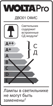
1 Шамда қирталған ЖД модульдері бар. Шырағданы шамдарды жіктену жиыны емес.

Өндіруші: «Вольта» ЖШҚ 119361, Мәскеу қ., Наташа Ковшова к-сі, 4 үй, 1 бет, оф. 23. Өндіруші бұйымның конструкциясына (техникалық параметрлерді және/немесе сыртқы түрін өзгерту) және жиынтықтауға тұтынушылық қасиеттерін айтарлықтай өзгертей, алдын ала ескертусіз өзгерістер енгізеді. Істен шыққан шырағданның сатып алынғандығын расталуы шырағданның сатып алынған күнін растайтын топтырылған кепілдік талоны болмаса КЕТ чегі (немесе қатан есептеме бланкісі) болып табылады. Кепілдік мерзімі ішінде ақулық орын алған жағдайда, Сіз өзіңіздің жарықдиодты шырағданыңызды жаңасына ауыстыра аласыз. Ауыстыру шарасы дұрыс топтырылған кепілдік талонын көрсеткеннен кейін (сатылған күнін, дүкеннің мөртбабын көрсетіңіз) іске асырылады. Тауардың сапасы бойынша наразылықтарды қабылдауға өкілетті тұлға: «Леруа Мерлен Казахстан» ЖШС, Қазақстан Республикасы, 050000, Алматы қ., Қонаев көш., 77, «ParkView» БО, б қ., №07 кеңсе. «Wolta Kazakhstan» ЖШС, 050044, Қазақстан Республикасы, Алматы қаласы, Жібек Жолы көшесі, 50 үй, 604 оф. тел: +7 (727) 973 09 55, info@wolta.kz.