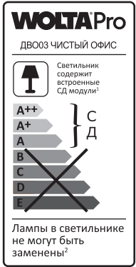
1 Шамда кірістірілген ЖД модульдері бар

«Волта Русланд» ЖШҚ тапсырысы бойынша шығарылған, 119361, Мәскеу қ., Наташа Ковшова к-сі, 4 үй, 1 бет, оф. 23. Өндіруші: «Лайтлед» ЖШҚ, Ульяновск облысы, Ульяновск қаласы, Мәскеу тас жолы, 14 үй. Өндіруші бұйымның конструкциясына (техникалық параметрлерді және/немесе сыртқы түрін өзгерту) және жиынтықтауға тұтынушылық қасиеттерін айтарлықтай өзгертпей, алдын ала ескертусіз өзгерістер енгізеді. Істен шыққан шырағданның сатып алынғандығын расталуы шырағданның сатып алынған күнін растайтын толтырылған кепілдік талоны болмаса КБТ чегі (немесе қатаң есептеме бланкісі) болып табылады. Кепілдік мерзімі ішінде ақаулық орын алған жағдайда, Сіз өзіңіздің жарықдиодты шырағданыңызды жаңасына ауыстыра аласыз. Ауыстыру шарасы дұрыс толтырылған кепілдік талонын көрсеткеннен кейін (сатылған күнін, дүкеннің мөртабанын көрсетіңіз) іске асырылады. Тауардың сапасы бойынша наразылықтарды қабылдауға өкілетті тұлға: «Леруа Мерлен Казахстан» ЖШС, Қазақстан Республикасы, 050000, Алматы қ., Қонаев көш., 77, «ParkView» БО, 6 қ., №07 кеңсе. «Wolta Kazakhstan» ЖШС, 050044, Қазақстан Республикасы, Алматы қаласы, Жібек Жолы көшесі, 50 үй, 604 оф. тел: +7 (727) 973 09 55, info@wolta.kz.